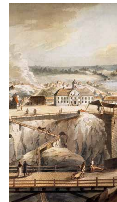
Falu Gruva i färg av Johan Fredrik Martin ca 1800.

Vattenhjul användes för att pumpa upp vatten och för att hissa upp malm. De användes vid gruvan ända fram till 1916.