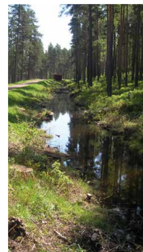
Nya Krondiket byggdes efter Polhems idéer på 1700-talet.

Tre större sjöar längre söderut, Stora, Lilla och Södra Vällan, användes tidigt som vattenmagasin. På 1600-talet dämdes de upp, så att de för- enades till en sjö och blev det stora vattenmagasinet för gruvan. Vid det s.k. Korset fanns en möjlighet att dela vattnet mellan hyttorna i Gamla Bergget och Ingvarvet samt gruvan.