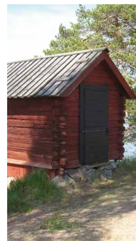
Dammhuset vid Korsgårdsdammen, det äldsta bevarade, fanns före 1691.

De flesta hyttorna lades ner vid mitten av 1800-talet. Längs vattnets väg kan du se flera hyttplatser i form av slagghvarp och andra lämningar, bl.a. i Korsgården, Gamla Bergget, Dammen och Övre Glamsarvet.