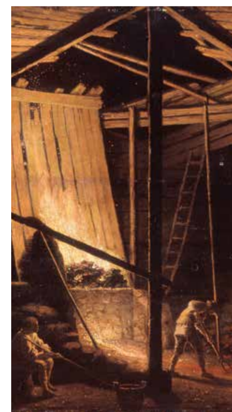
Interiör från en kopparhytta i Falun, målad av Pehr Hilleström på 1780-talet.